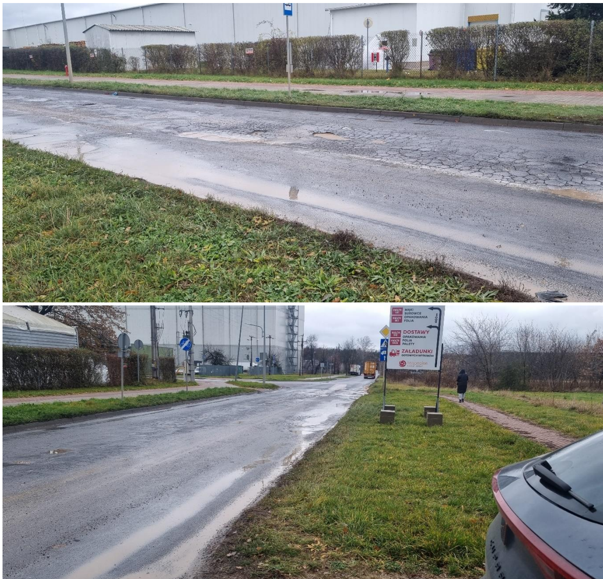
Fotografia 1. Dokumentacja z inwentaryzacji terenowej ul. Przemysłowej